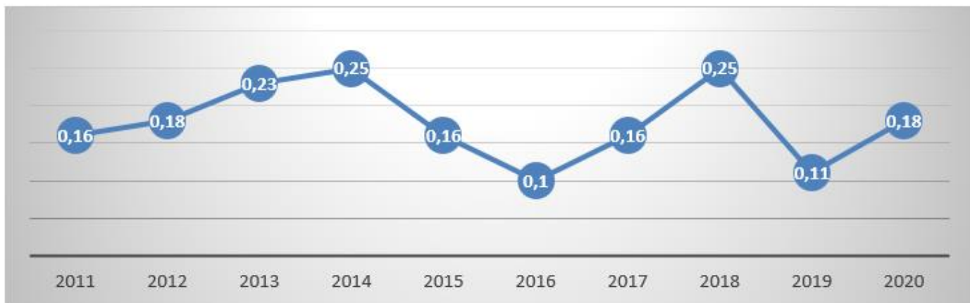
Figure 4 : Flux des IDE entrants au Maroc en MM$