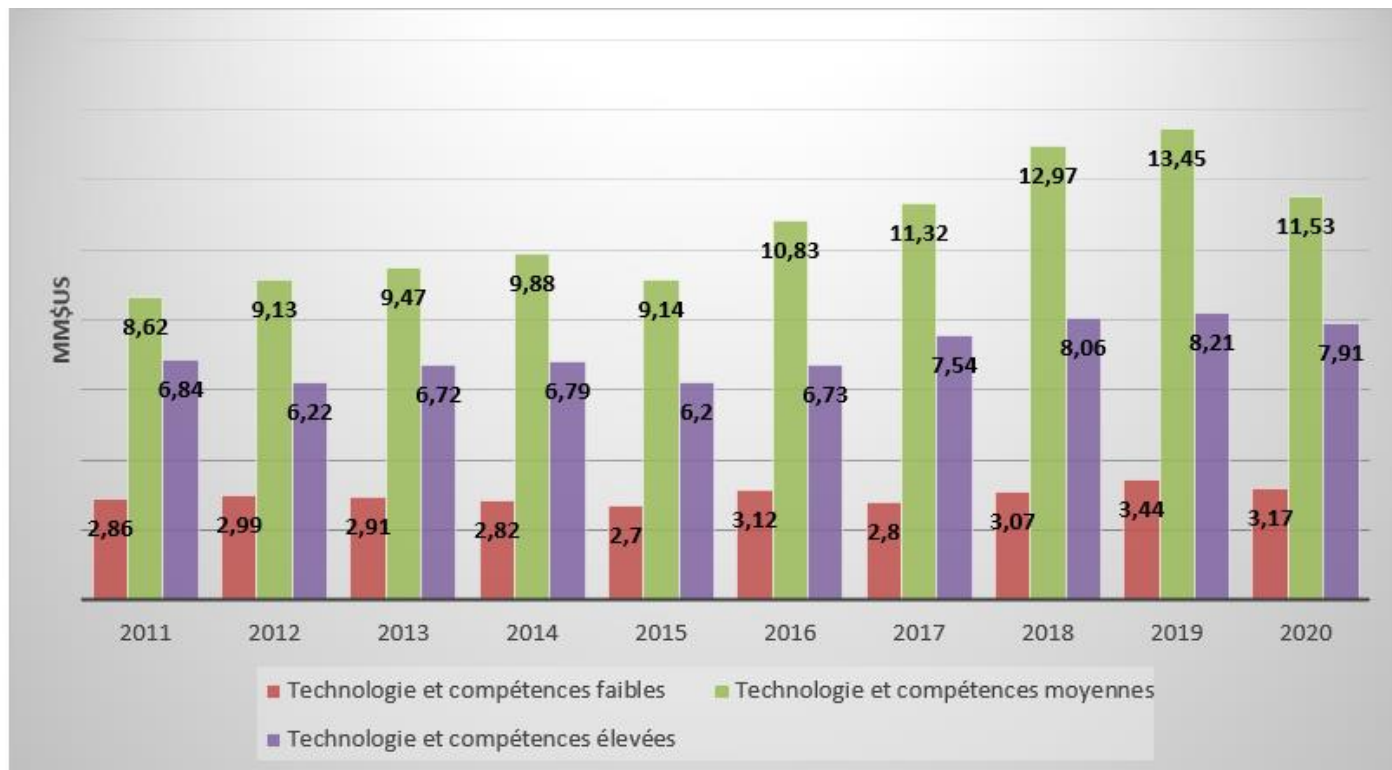
Figure 2 : Importations marocaines des produits manufacturés par niveau technologique

Source : Confectionnée par nos soins sur la base des données CNUCED