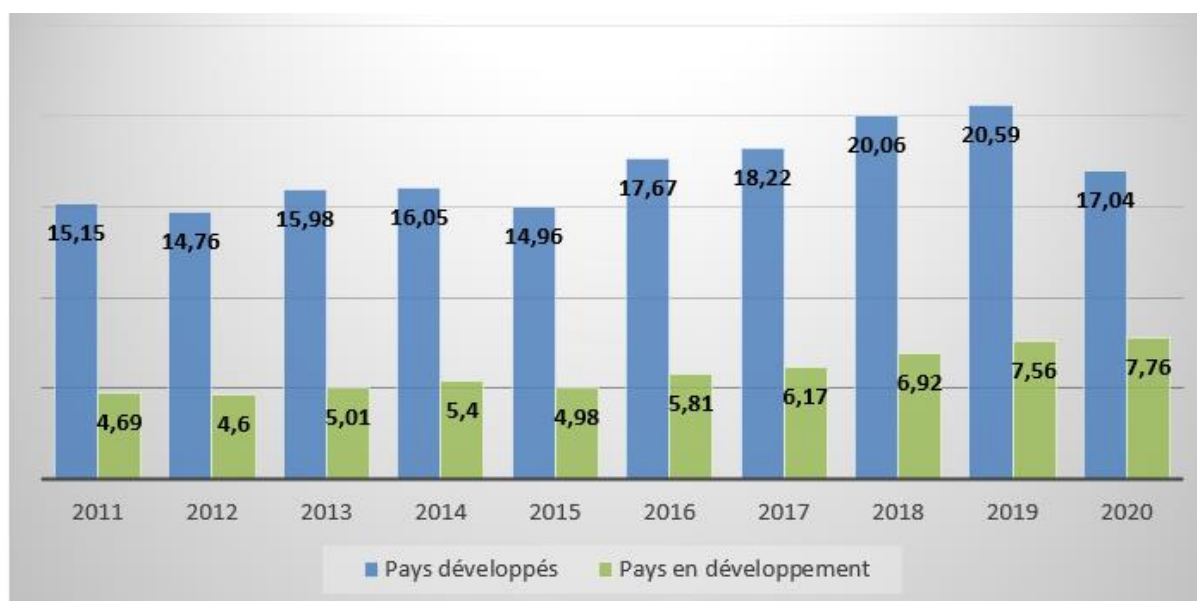
Figure 1 : Volume des importations à contenu technologique en MM$ des pays développés et en développement

Source : Confectionnée par nos soins sur la base des données CNUCED