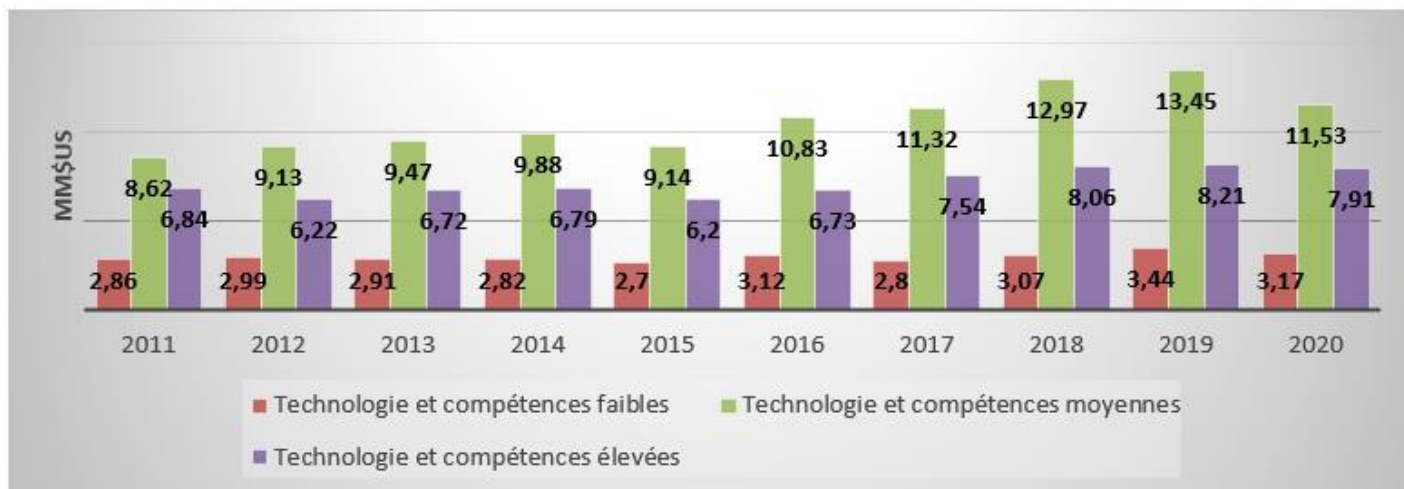
Figure 5 : Flux des IDE en MM$ par niveaux technologiques