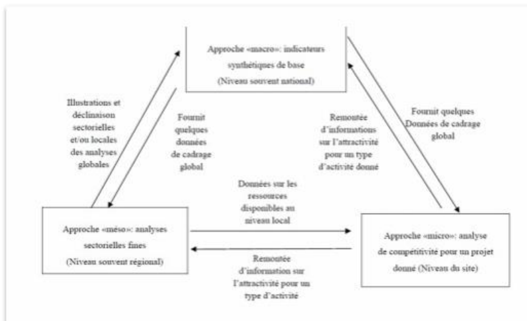
Figure n°1 : les approches de l'attractivité territoriale

Comme le définit (Fabrice HATEM 2007), pour mesurer l'attractivité du territoire, cinq grandes catégories d'approches peuvent être distinguées, désignées par les termes suivants : « macro », « méso », « micro », « processus de décision », « image ». Pour l'étude, l'approche « macro » a été privilégiée, avec des indicateurs globaux, qui ont ensuite été affinés. Cette approche vise à identifier les déterminants globaux expliquant la plus ou moins bonne attractivité des personnes physique sur un territoire. Le but final étant de réaliser un « baromètre » de l'attractivité à partir de la collecte d'un nombre élevé d'indicateurs comparatifs permettant d'« étalonner » un territoire par rapport à ses concurrents selon un très grand nombre de critères. Cette approche conduit notamment à deux résultats intéressants : d'une part, la constitution, sur une base homogène de « tableaux de bord » permettant d'identifier les « points forts » et les « points faibles » du territoire concerné ; d'autre part, la réalisation d'indicateurs de synthèse sur l'attractivité. L'originalité de cette méthode est qu'elle peut associer des sources provenant de statistiques comparatives (INSEE, DREAL...) et des enquêtes d'image et/ou d'opinion auprès de décideurs, ici des personnes physiques (Fabrice HATIM 2005).